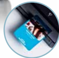
Слот за пластички