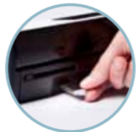
Сканиране към USB