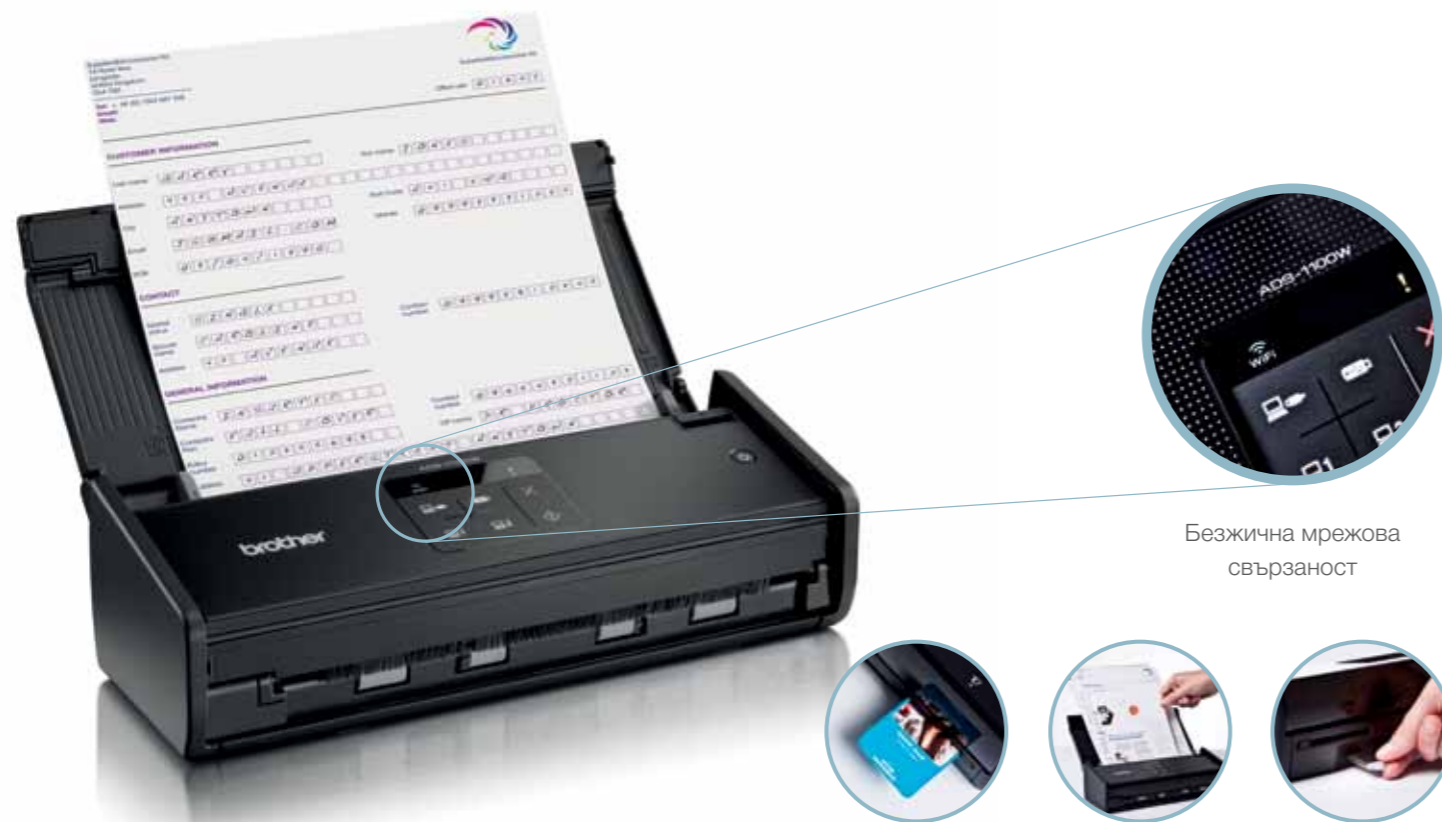
Безжична мрежова свързаност

ADS-1100W сканира без усилие Вашите документи оставяйки софтуера да се погрижи за останалото, а за вас остава удоволствието от добре свършената работа.