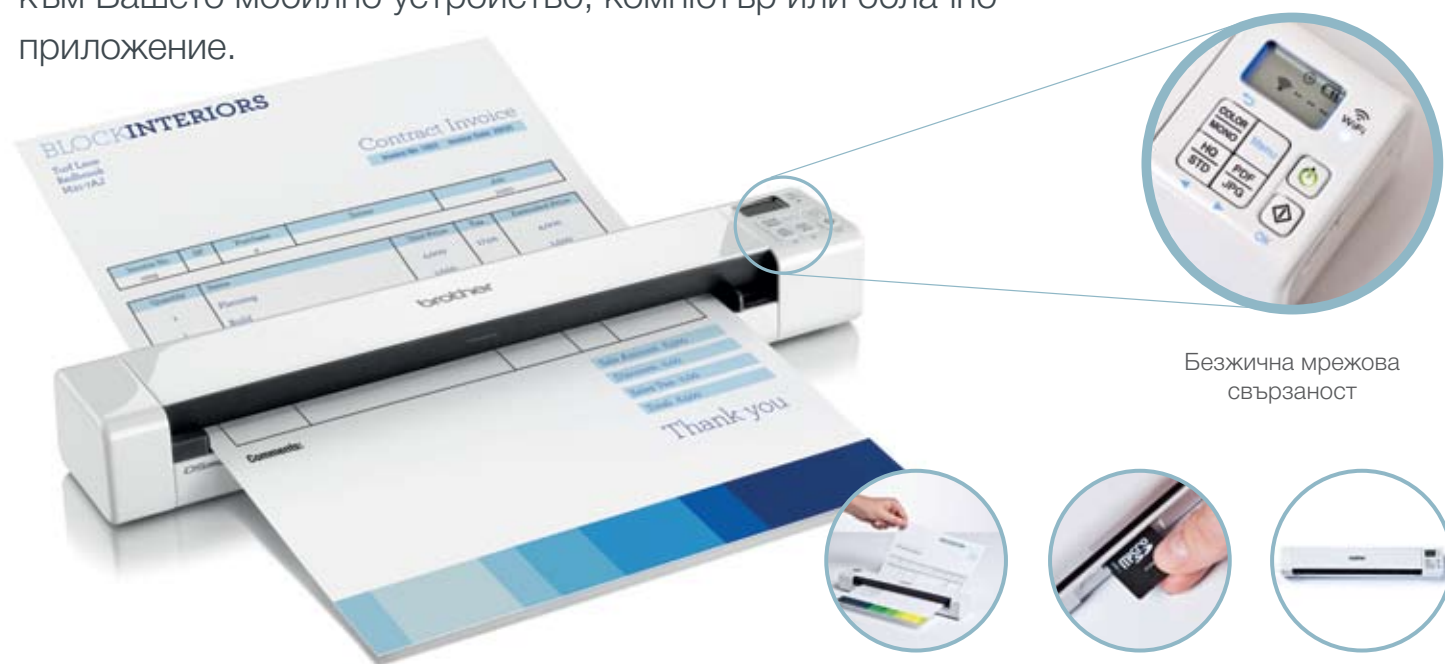
Безжична мрежова свързаност

DS-820W променя всичко, от начина по който работите, до това къде работите. Снабден с множество функции в компактен дизайн този скенер прави деня Ви ползотворен. Дори когато сте в движение, захранването от презареждаема батерия Ви позволява да сканирате директно към SD карта и през безжична мрежа да прехвърлите информацията към Вашето мобилно устройство, компютър или облачно приложение.