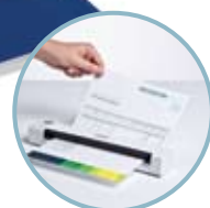
Захранване с батерия